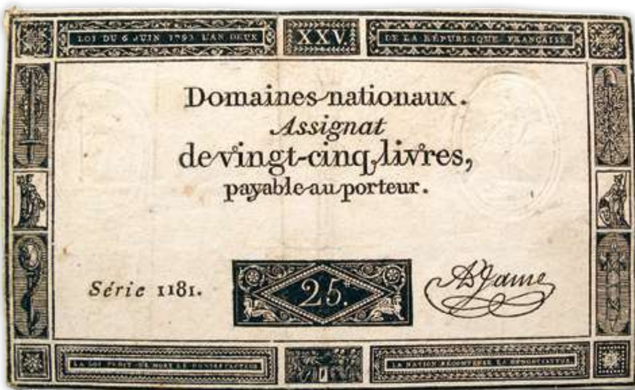
Kuva 9. 25 livren seteli vuoden 1793 alusta. Viittauksia kuninkaaseen ei enää löydy.