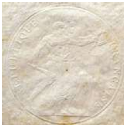
Kuva 6. Yksityiskohta valokuvan 1 setelin puristelemasta.

tekijät olleet tekniikaltaan väärentäjien ulottumattomissa. Tämä tulee ilmi tekstistä: "la loi punit de mort le contrefacteur / la nation récompense le dénonciateur" (suom. Laki rankaisee väärentäjää kuolemantuomilla / Valtio palkitsee ilmiantajan). Sisältönsä vuoksi nämä voidaan laskea turvatekijöiksi, sillä giljotiinin kultakaudella uhkaus oli syytä ottaa todesta. Vallankumouksen lop-