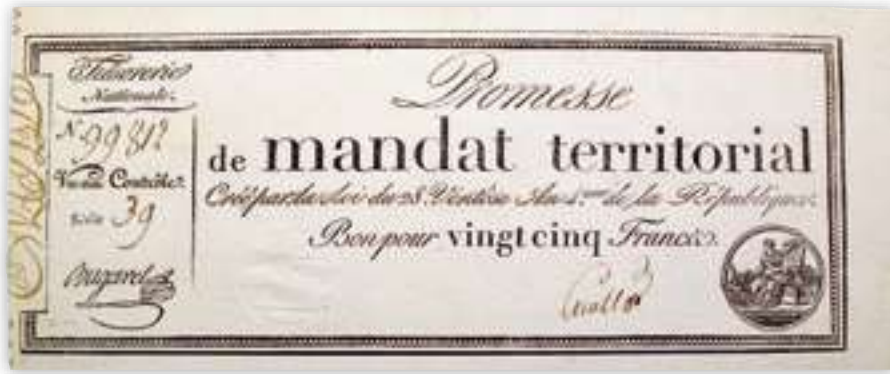
Kuva 2. 25 frangin mandat territorial vuodelta 1796.

nolla kuivua ennen kiertoon päätymistä. Vasta tällöin Ranskan ajautui inflaation kouriin. Tätä tietoa tukevat vallankumouksen aikaisissa sanomalehdissä säilyneet hintatiedot ja hyperinflaatio iski vasta vuonna 1795. 8 Viimeisenä virheenä voidaan pitää toukokuusta 1793 joulukuun 1794 loppuun asti voimassa ollutta hintakontrollia ( terreur économique ), joka asetti tuotteille maksimihinnat.