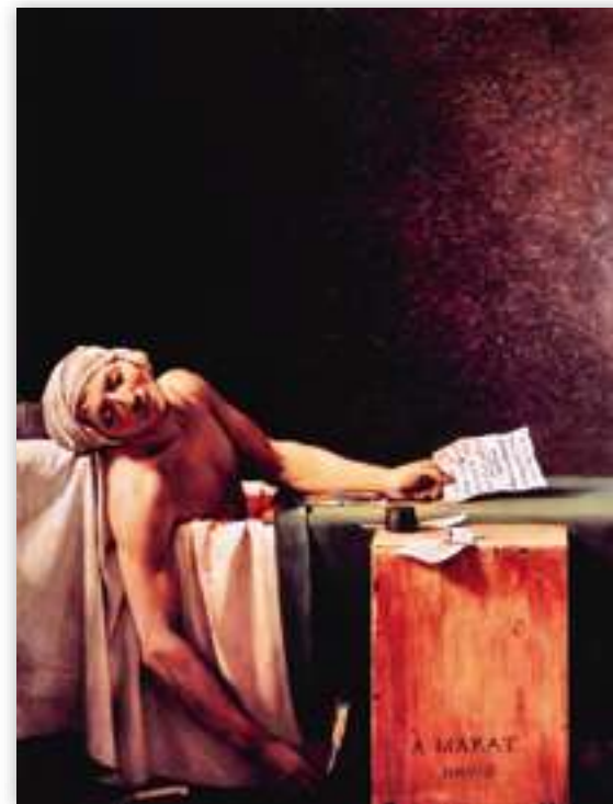
Kuva 3. Marat’n kuolema. Jacques-Louis David, 1793. Öljy kankaalle. Royal Museums of Fine Arts of Belgium.