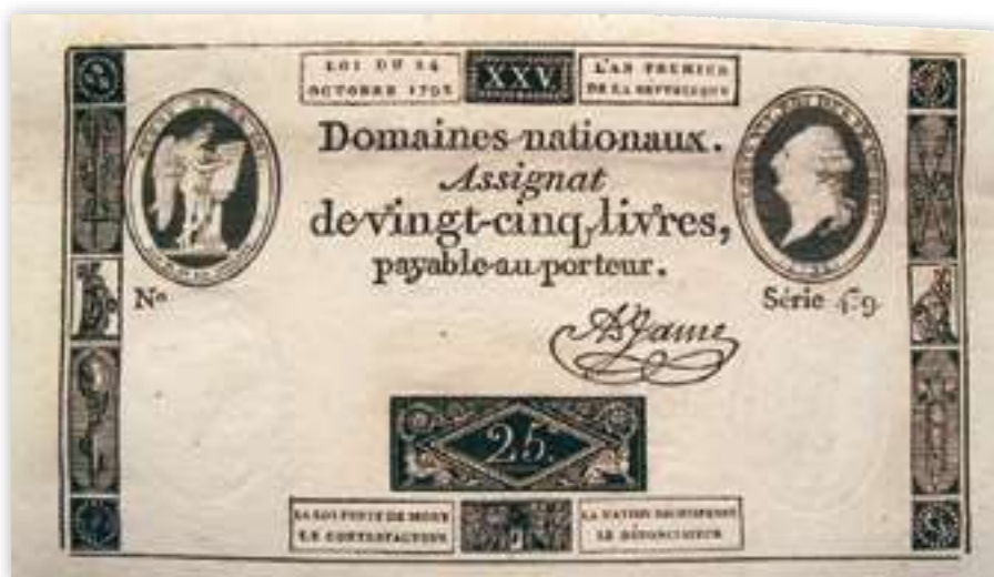
Kuva 8. 25 livren seteli vuodelta 1792. Viimeinen assignaatti, jossa Ludvig XVI esiintyy.

Taws, Richard. 'The Currency of Caricature in Revolutionary France' in The Efflorescence of Caricature, 1715-1838 , toim. Todd Porterfield, 2011. s. 95-115.