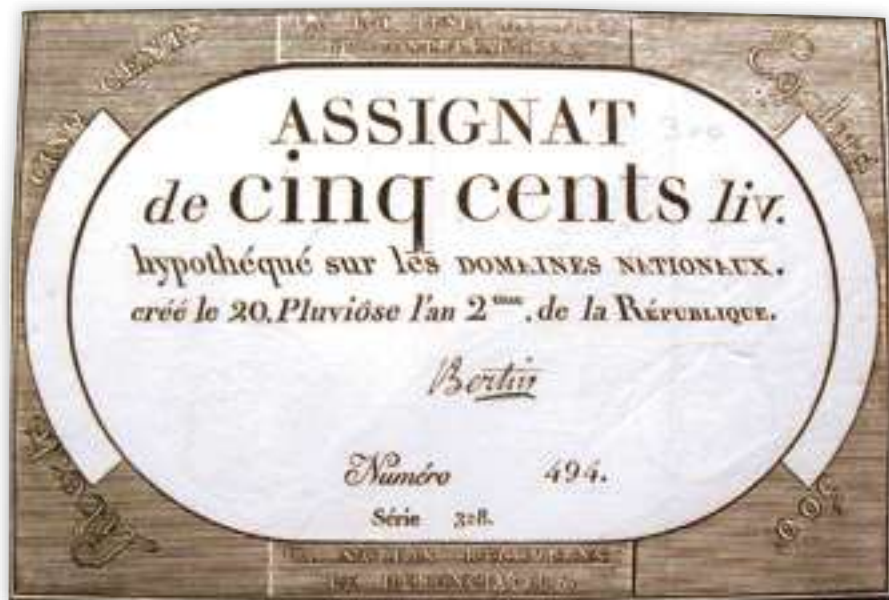
Kuva 5. 500 livren assignaatti vuodelta 1794. Kyseisessä setelissä on 8 piilopistettä.

tekijät olleet tekniikaltaan väärentäjien ulottumattomissa. Tämä tulee ilmi tekstistä: "la loi punit de mort le contrefacteur / la nation récompense le dénonciateur" (suom. Laki rankaisee väärentäjää kuolemantuomilla / Valtio palkitsee ilmiantajan). Sisältönsä vuoksi nämä voidaan laskea turvatekijöiksi, sillä giljotiinin kultakaudella uhkaus oli syytä ottaa todesta. Vallankumouksen lop-