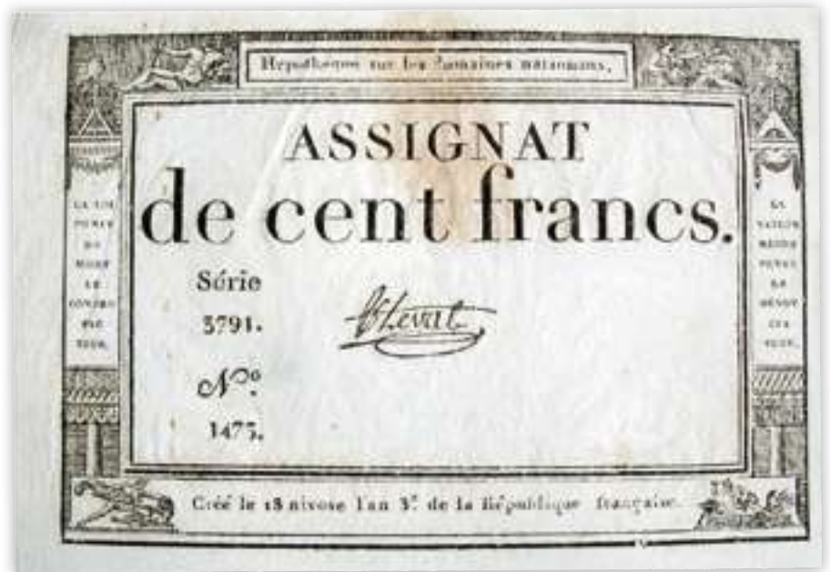
Kuva 1. 100 frangin assignaatti vuoden 1795 alusta.